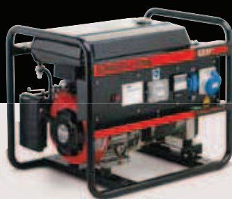
Combiplus 3700LE/5700LE 6700LE